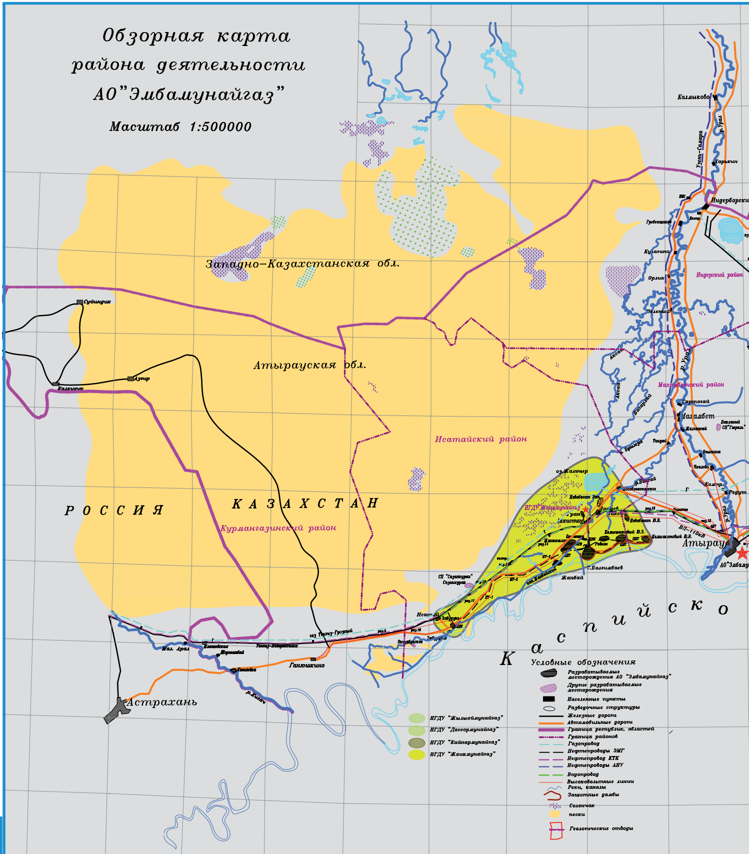
Обзорная карта района деятельности АО "Эмбаунайгаз" Масштаб 1:500000